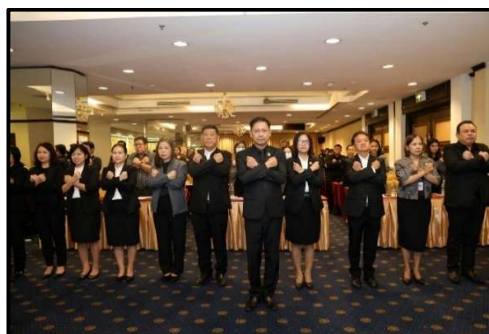
ร่วมกิจกรรมต่อต้านการทุจริตคอร์รัปชัน