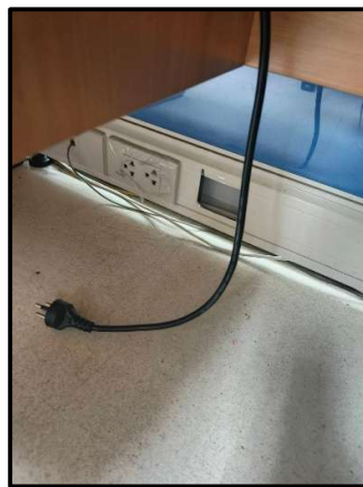
การประหยัดพลังงาน (ถอดปลั๊กไฟเมื่อไม่ใช้งาน)