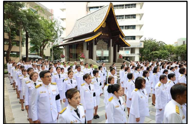
แต่งกายให้ถูกต้องตามระเบียบของทางราชการ ในการร่วมพิธีลงนามถวายความอาลัยและน้อมรำลึก ในพระมหากรุณาธิคุณสมเด็จพระบรมราชชนนีพันปีหลวง