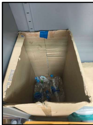
การใช้ทรัพยากรอย่างคุ้มค่า (คัดแยกขยะรีไซเคิล)