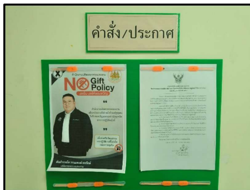
บอร์ดประชาสัมพันธ์ No Gift Policy งดรับ งดให้ของขวัญ