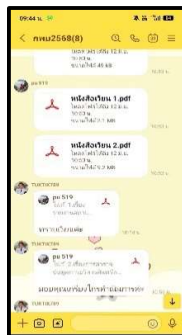
ใช้ Line เป็นช่องทางการสื่อสาร