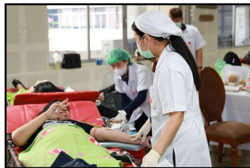
ร่วมกิจกรรมบริจาคโลหิต