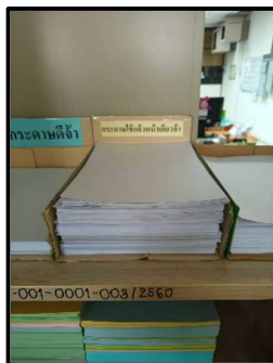
วางจุดเก็บกระดาษใช้แล้ว หน้าเดียวในพื้นที่ส่วนกลาง