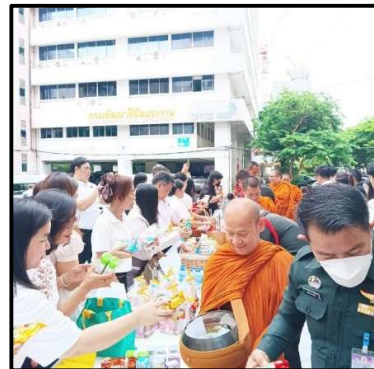
ร่วมกิจกรรมทำบุญตักบาตรในวันสำคัญทางพระพุทธศาสนาต่าง ๆ