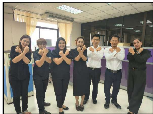
กลุ่มพัฒนาระบบบริหาร ร่วมประกาศเจตนารมณ์ No Gift Policy