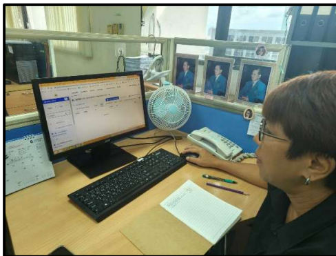
การใช้ระบบ e-Office แทนการใช้กระดาษ