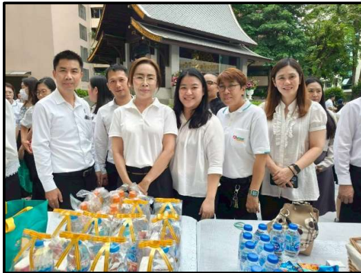
ร่วมแต่งกายตามที่กระทรวงแรงงานกำหนด ในโอกาสสำคัญต่าง ๆ